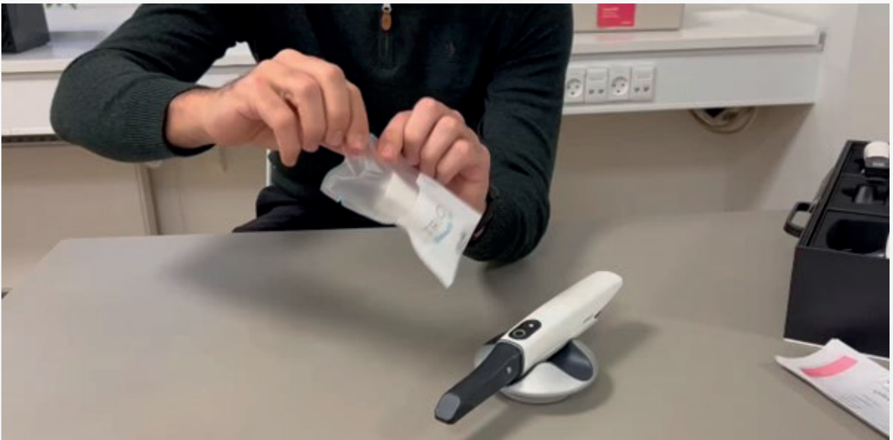
Application de l'embout

Chaque patient est scanné avec un nouvel embout, ce qui réduit le risque de contamination croisée.